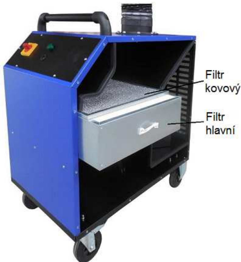
Obrázek 2 – Výměna filtrů