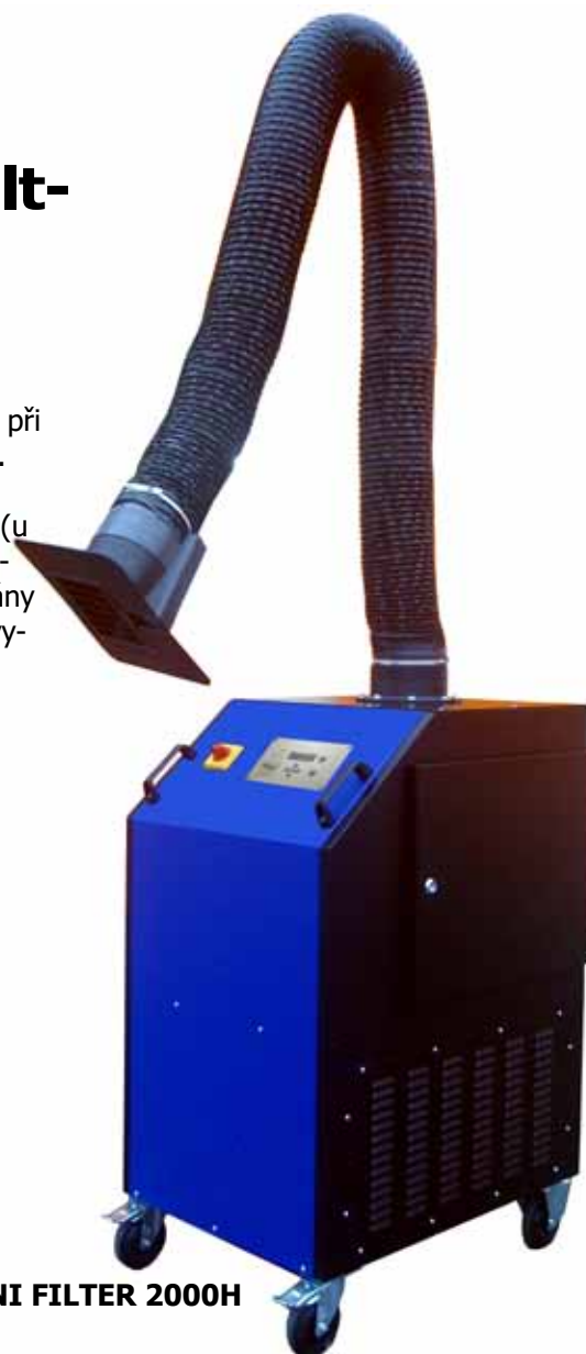
UNI FILTER 2000H

The extractors meet the requirements of the CE and are manufactured the EU.