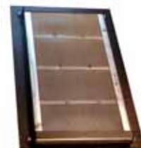
Filtr kapsový UNI 2000H Filter Glass microfibre rigid pocket bag