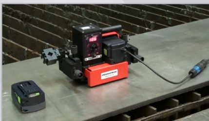
Volitelné napájení 110-240 V