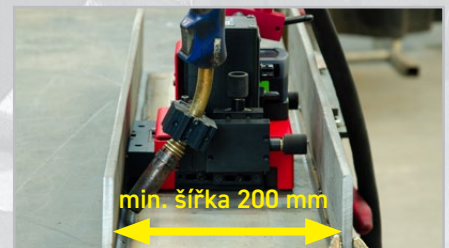
Svařování v úzkých prostorech