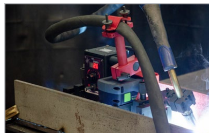
Umístění hořáku na obou stranách