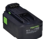
5.2 Ah baterie AKM-000086