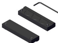
Pomocné magnetické bloky ZST-0655-09-00-00-0

Více informací najdete na www.promotech.eu