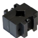
Držák hořáku ZCS-0270-42-00-00-0