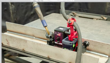
Svařování v celé délce, od okraje k okraji