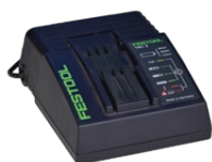
Nabíječka baterií LDW-000006 (220-240 V, 50/60 Hz) LDW-000007 (120 V, 60 Hz)