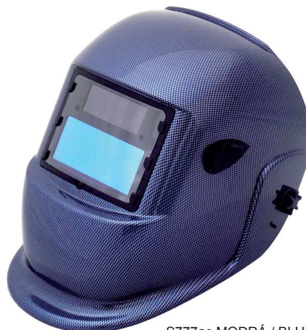
S777ac MODRÁ / BLUE

Protection for the whole face, biaxially adjustable centre of gravity