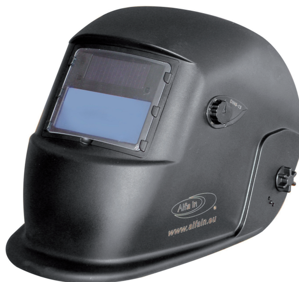
S777a ŠEDÁ / GRAY

Ochrana celé tváře, nastavitelná poloha těžiště ve dvou osách